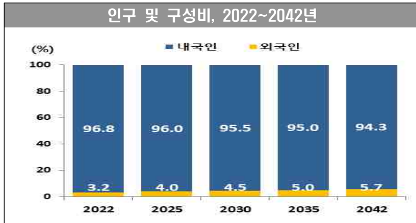
[그림 1] 총인구 대비 외국인 구성 (2022~2042년)

문39. 한국사회는 저출산 고령화로 인해 생산연령인구가 감소하고 있습니다. 이로 인해 일부 산업분야에서는 인력 부족 문제가 심각한 상황입니다. 귀하는 노동력이 부족한 산업분야에서 필요한 인력을 외국으로부터 들어오는 것에 대해 어떻게 생각하십니까?