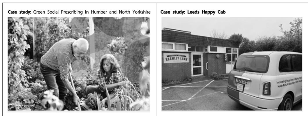
| 그림 3. 그린 사회적 처방과 해피캡 사업 |

자료: DCMS. (2023). Tackling Loneliness annual report March 2023: the fourth year.